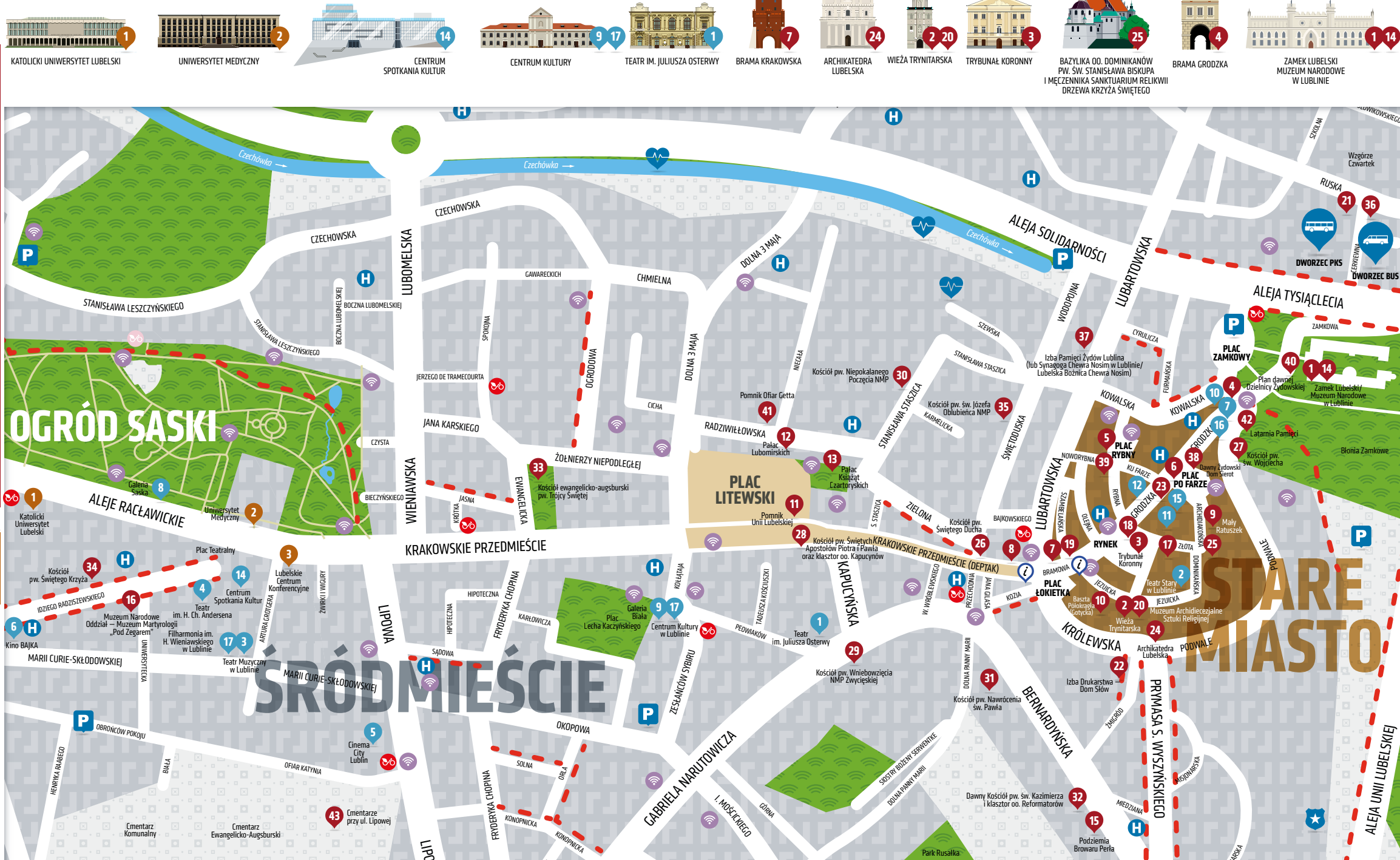
1 KATOLICKI UNIWERSYTET LUBELSKI